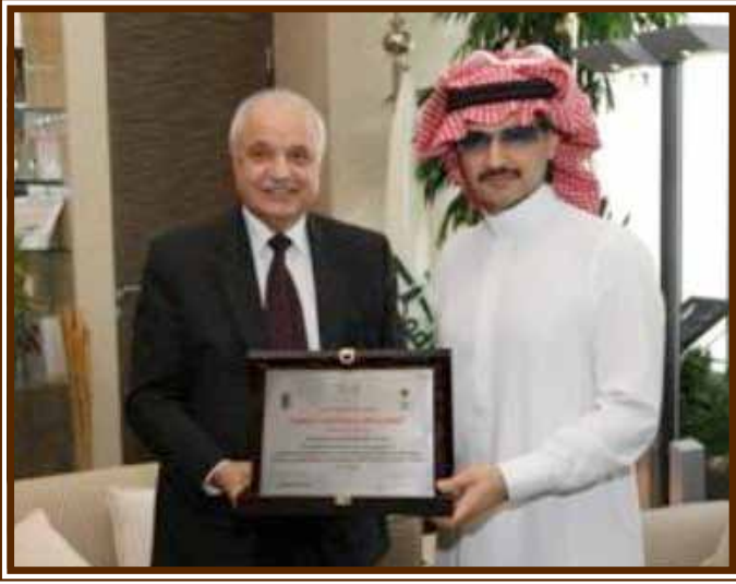
... ومع صاحب السمو الملكي الأمير الوليد بن طلال بن عبد العزيز