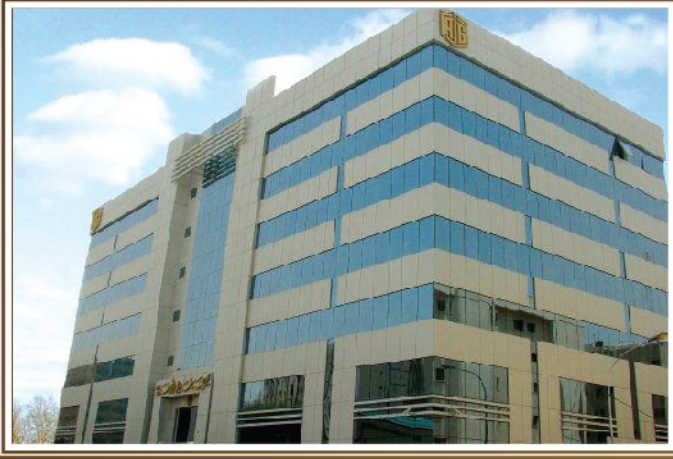
- الرياض -