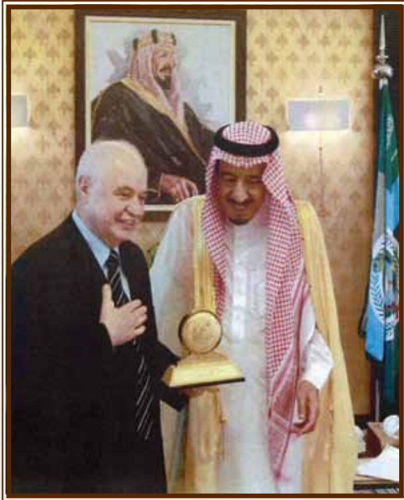
صاحب السمو الملكي الأمير سلمان بن عبد العزيز ولي العهد ونائب رئيس مجلس الوزراء يكرم و. طلال أبوغزاله ٢٠١٢

وخصصت في المكاتب قاعات مجهزة لتنفيذ برامج للتدريب المعتمده في المجموعة ومنها برنامج أبوغزاله كامبردج لمهارات تقنيه المعلومات الذي يمنح الدبلوم الدولي في مهارات تقنية المعلومات وجرى تعزيز هذه المكاتب بالخبراء والكوادر المهنية المؤهلة تأهيلا عاليا في كافة التخصصات وخدمات المجموعة لتقديم افضل ما لديها وفق المعايير الدولييه عالية الجودة، لترسيخ أسم وسمعة المجموعة لدى قطاعات الاعمال والمجتمع الاقتصادي في المملكة والخليج العربي والاستمرار في المحافظه على المستوى العالمي الذي خدمنا فيه وما زلنا دول المنطفة و تعزيز رسالتنا.