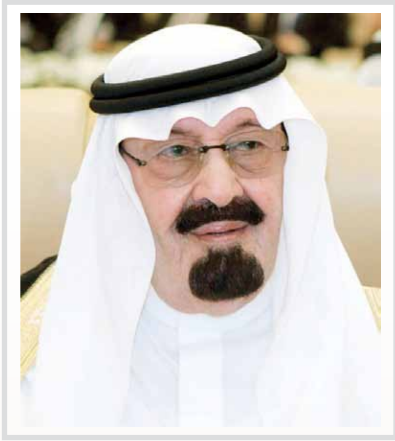
خادم الحرمين الشريفين (الملك عبد الله) بن عبد العزيز آل سعود

تسجل مجموعة طلال أبوغزاله بكل الاعتزاز والفخر إحتضان المملكة العربية السعودية لمكاتبها في الرياض وجده والخبر و ابها.