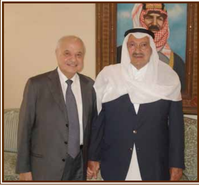
... ومع صاحب السمو الملكي الأمير طلال بن عبد العزيز