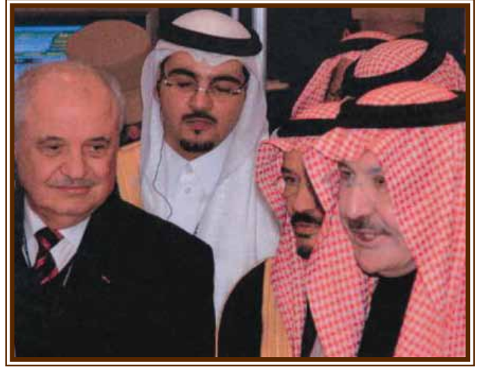
... ومع صاحب السمو الملكي الأمير سطاتم بن عبد العزيز