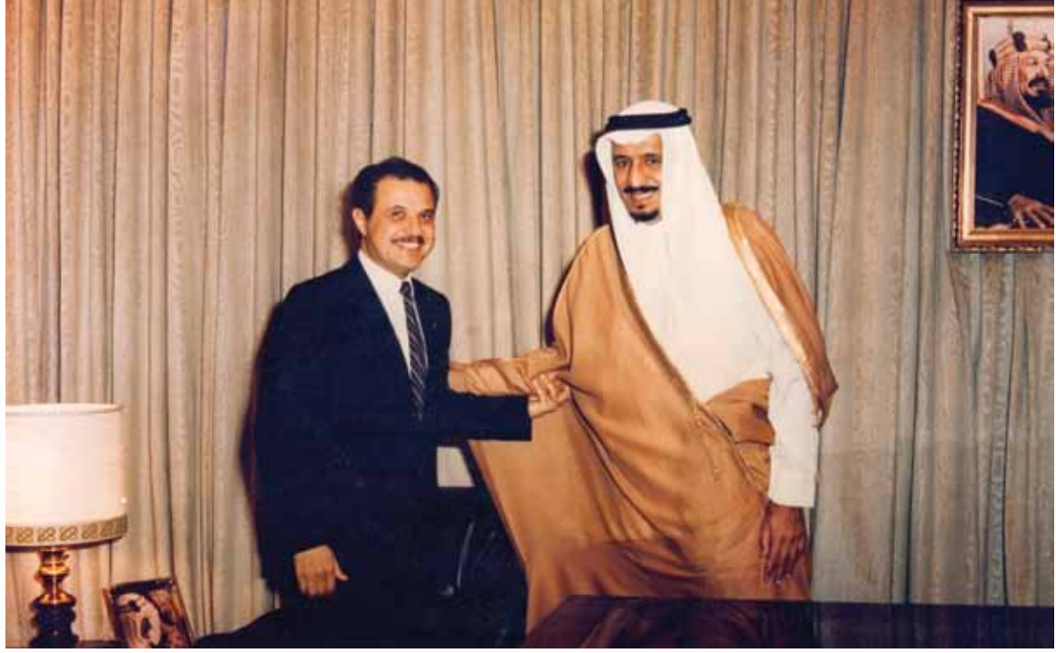
صاحب السمو الملكي الأمير سلمان بن عبد العزيز و. طلال أبوغزاله في مكتبه بالرياض - ١٩٧٢