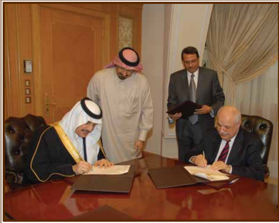
صاحب السمو الملكي الأمير محمد بن فهد بن عبد العزيز و د. طلال أبوغزاله

كما جرى تكريم مكاتب المجموعة في مناسبات عديدة من قبل صاحب السمو الملكي الأمير محمد بن فهد بن عبد العزيز وصاحب السمو الملكي الأمير سعود بن نايف بن عبد العزيز ومن جامعة نايف العربية للعلوم الأمنية، ومن الغرفة التجارية الصناعية ومن جامعة الأمير محمد بن فهد ومن إدارة التربية والتعليم في المملكة ومن صندوق الامير سلطان بن عبد العزيز إضافة الى العديد من قطاعات الأعمال والشركات.