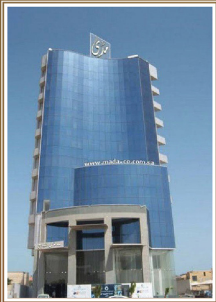
- الخبر -