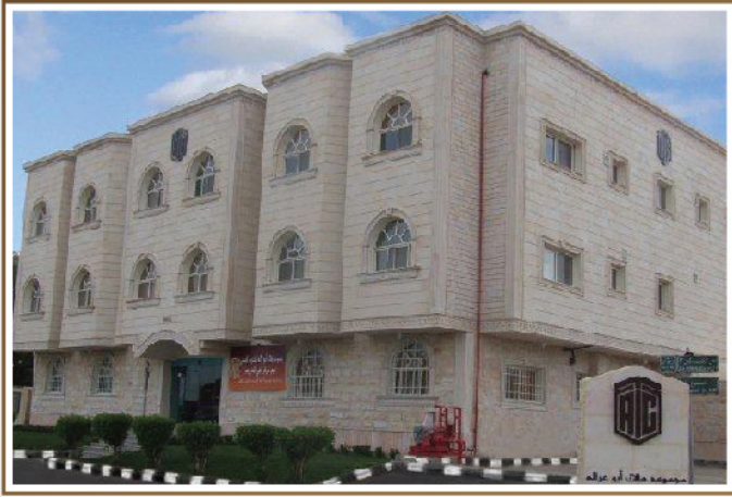
- جدة -

البريد الإلكتروني: tagco.jeddah@tagi.com