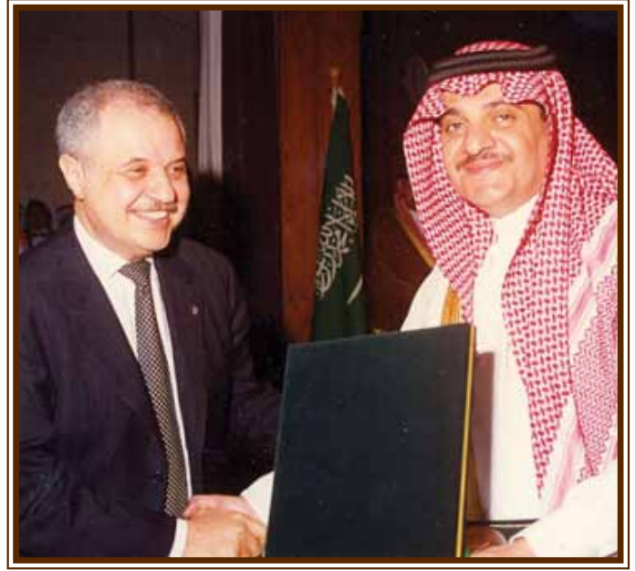
مع صاحب السمو الملكي الأمير سعود بن نايف بن عبد العزيز