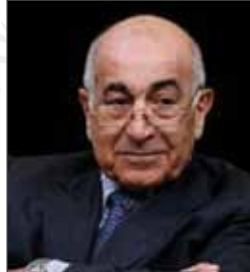
سعادة السيد حسن أبونعمه مستشار الرئيس