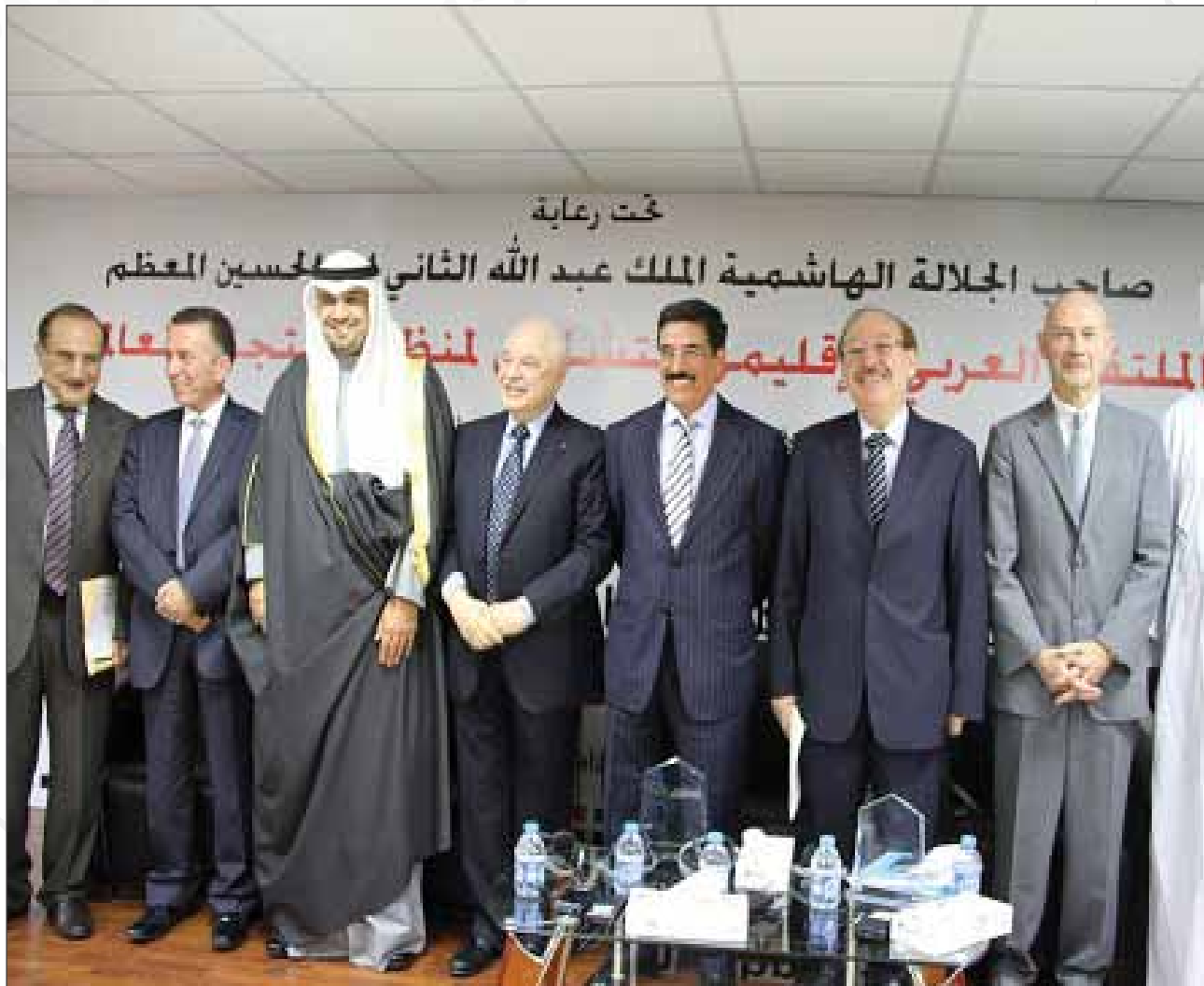
الملتقى العربي الاقليمي للتشاور في منظمة التجارة العالمية لعام ٢٠١٣