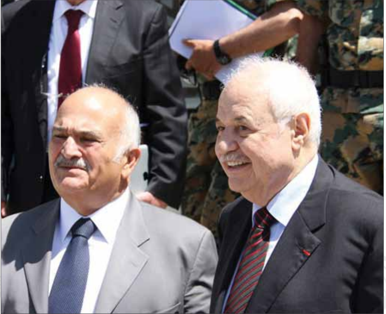
الامير الحسن يطلق الحوار حول الميثاق الاقتصادي العربي