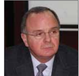
معالي المهندس سمير مراد