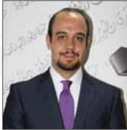
سعادة السيد فادي الداود