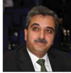
معالي الدكتور محمد ابو حمور