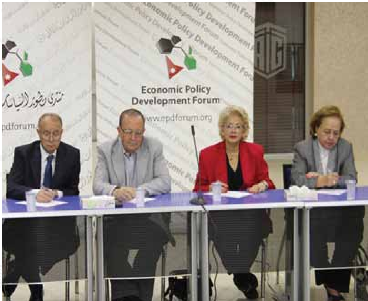
حلقة نقاشية حول نتائج فريق عمل المياه- المرصد الاردني الاقتصادي