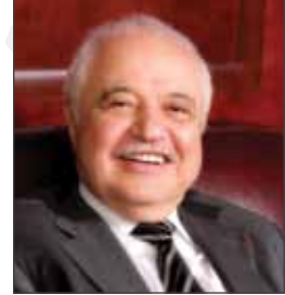
سعادة الدكتور طلال أبوغزاله الرئيس