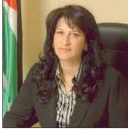
معالي السيدة مها الخطيب