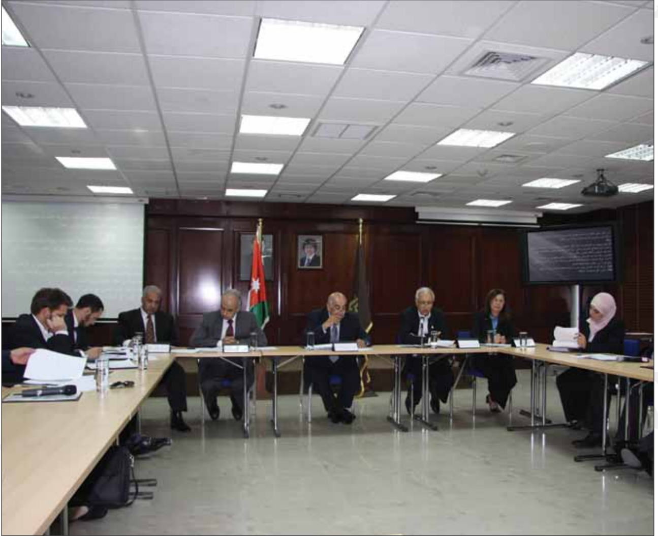
طاولة حوار مستديرة حول "السياحة العلاجية في الاردن"