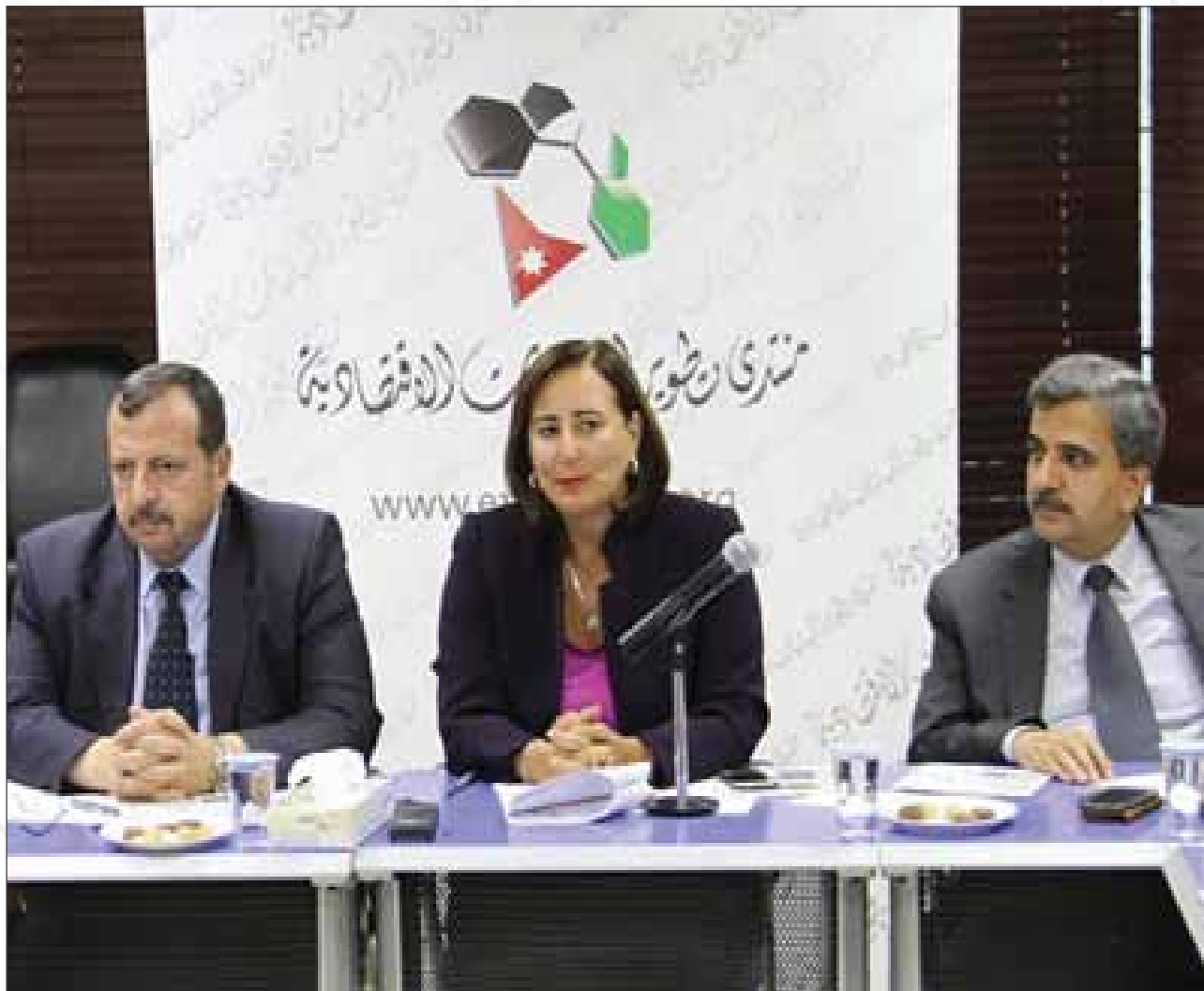
هيئة مرصد الميثاق الاقتصادي الاردني تناقش نتائج فريق عمل الطاقة- المرصد الاردني الاقتصادي