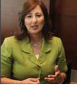
سعادة السيدة ريم بدران نائب الرئيس