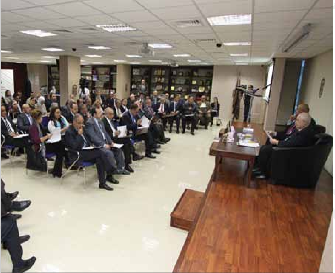
حوار في ملتقى طلال أبوغزاله المعرفي حول الاستثمار في الأردن