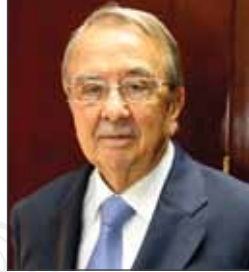
معالي السيد حمدي الطباع نائب الرئيس