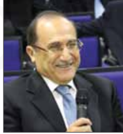
معالي الدكتور جواد العناني نائب الرئيس