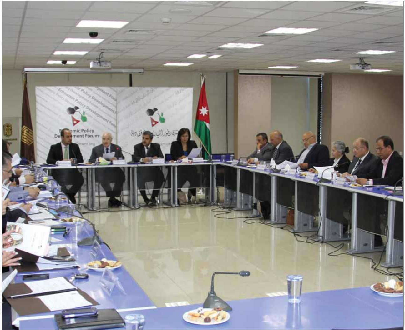
الاجتماع الثالث "رؤيا الاردن ٢٠٢١"