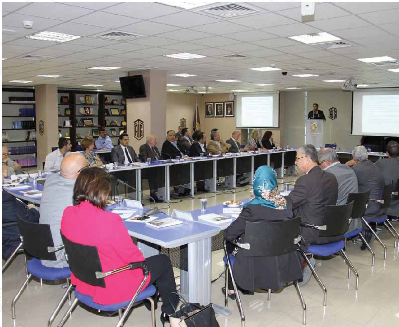
الجلسة النقاشية مع فريق من البنك الدولي حول "الفقر في الأردن ... قياسه من جديد"