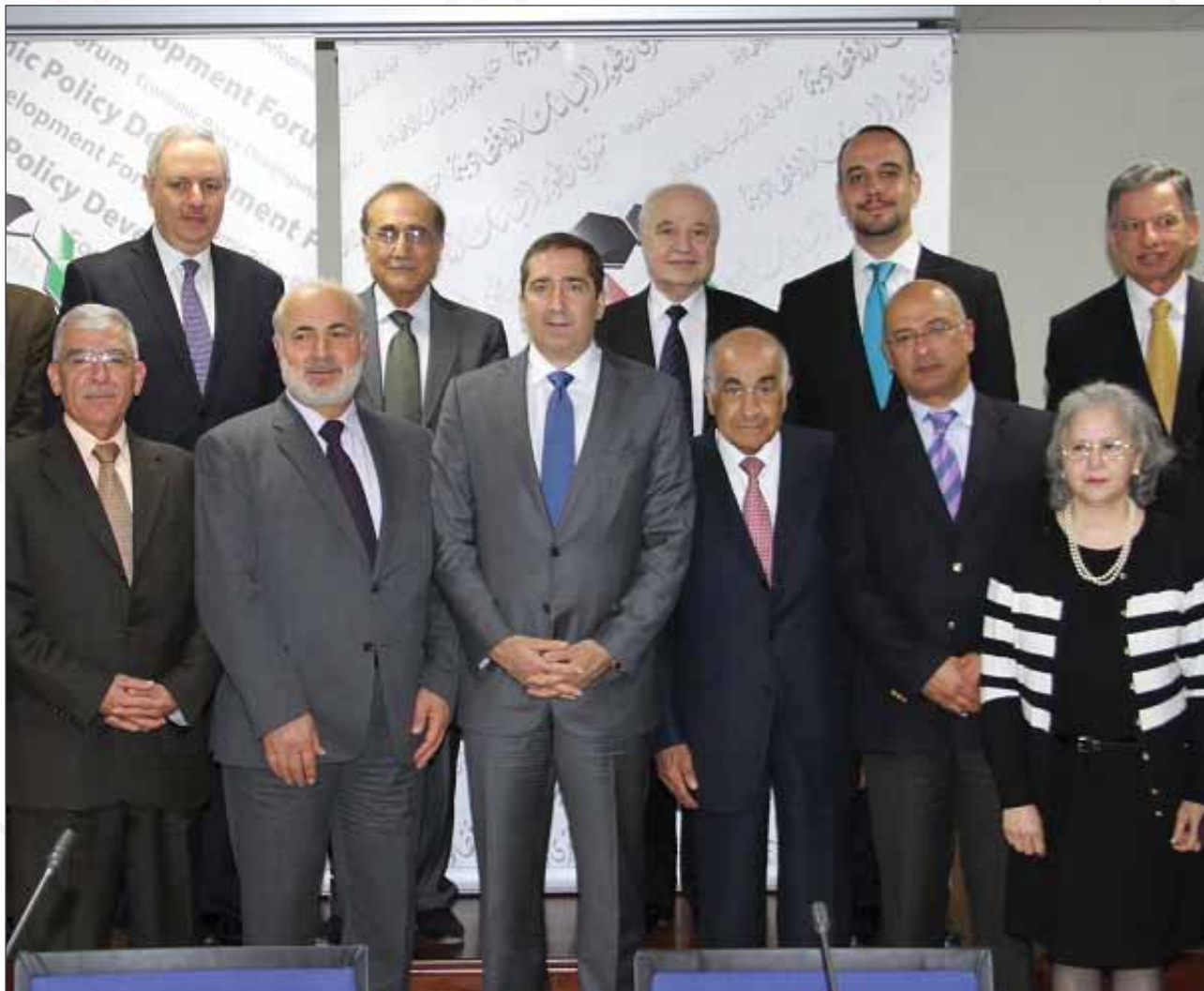
الاجتماع التأسيسي لمجلس الرؤية المستقبلية للأردن ٢٠٢١