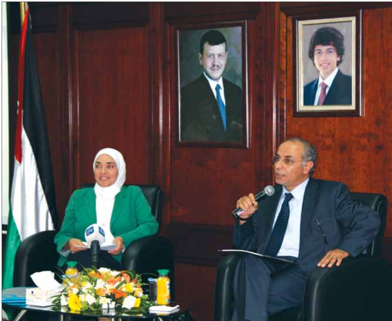
ندوة حوارية بعنوان "تقرير حالة سكان الاردن ٢٠١٠" بالتعاون مع المجلس الاعلى لسكان تموز ٢٠١٢