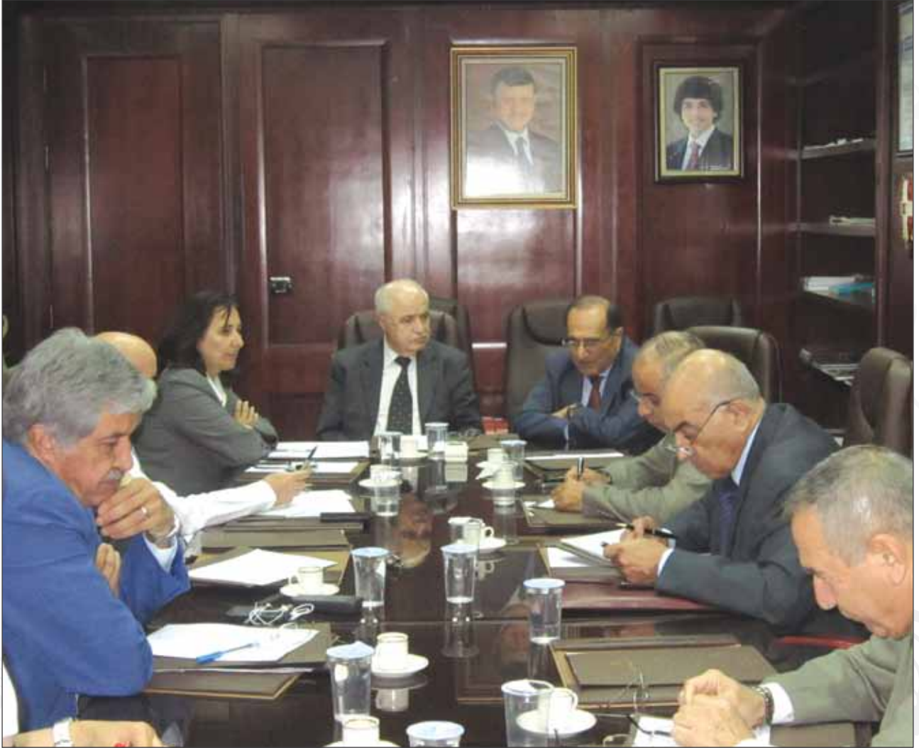
جلسة حوارية بعنوان "آلية معالجة الأزمة الاقتصادية" للدكتور جواد العناني أيلول ٢٠١٢