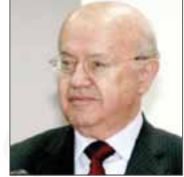
معالي السيد ثابت الطاهر