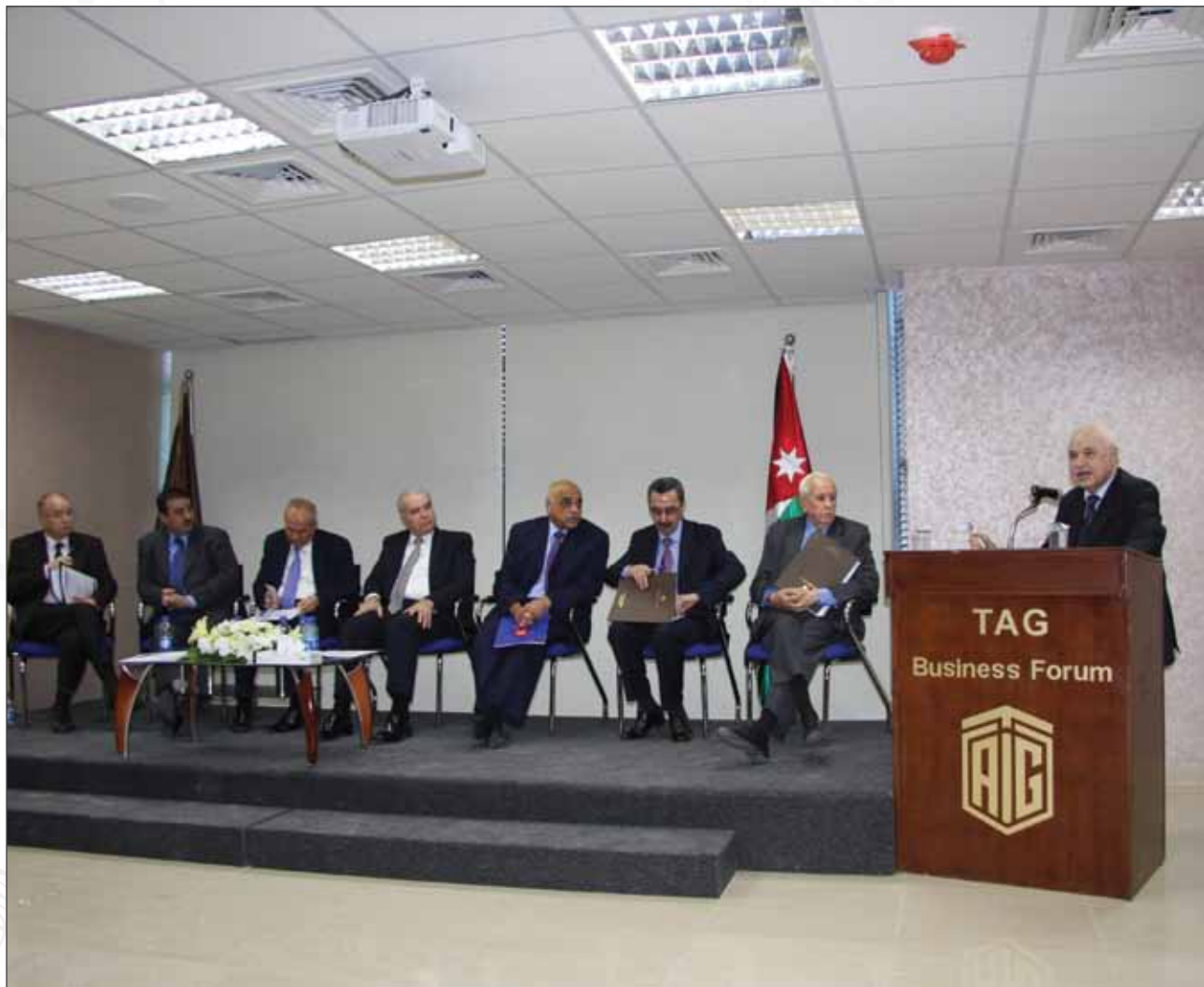
ندوة حوارية بعنوان "التعليم للعمل" بالتعاون مع مركز الرأي للدراسات تشرين ثاني ٢٠١٢