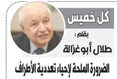
كل فيس: طلال أبوغزالة