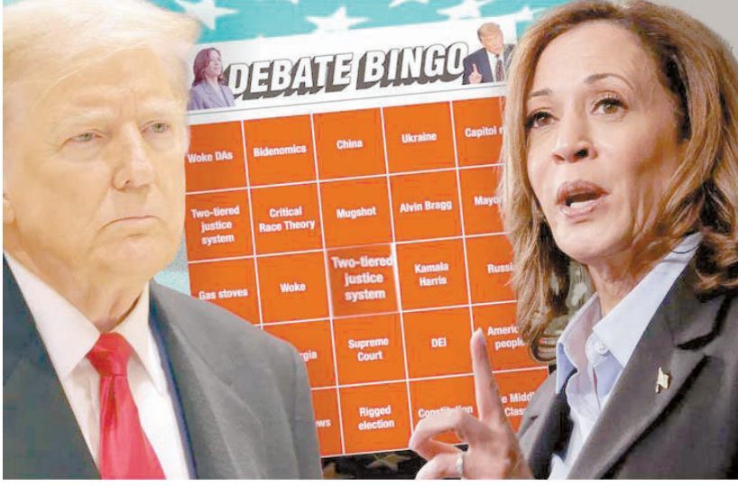
مراكز الاستطلاع: المرشحة الديمقراطية تستحوذ على 63% من آراء المواطنين

ترايب: إسرائيل ستزول «خلال عامين» إذا وصلت كامالا للحكم