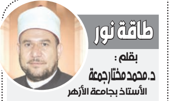
بمق: د.محمد مختار جمعة

أعلن حزب الله استهدافه أمس 4 مواقع إسرائيلية في مزارع شبعا، حيث استهدف موقع رئيسية القرن في مزارع شبعا اللبنانية المحتلة بالأسلحة الصاروخية وأصابه إصابة مباشرة.